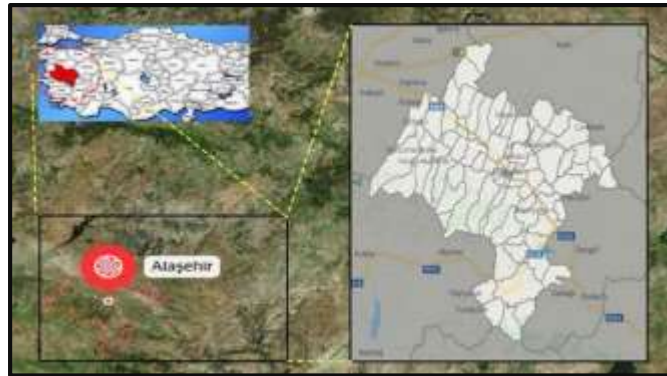
Şekil 1: Alaşehir İlçesi'nin Türkiye içi konumu (URL-2,2023)

Ege Bölgesinde yer alan Manisa ilinin, üzüm ihracatında ilk sırada bulunan ilçesi olan Alaşehir'in yüzölçümü 977 km 2 'dir. İlçenin rakımı ise 189 m'dir. Alaşehir ilçesinin güneyinde Sarıgöl ve Aydın, kuzeyinde Salihli ve Kula, doğusunda Uşak, batısında İzmir İli bulunmaktadır. Alaşehir ilçesi Akdeniz iklimi etkisinde olup, 2023 Türkiye İstatistik Kurumu(TÜİK) verilerine göre 104.717 nüfusa sahiptir ve 87 mahallesi bulunmaktadır.