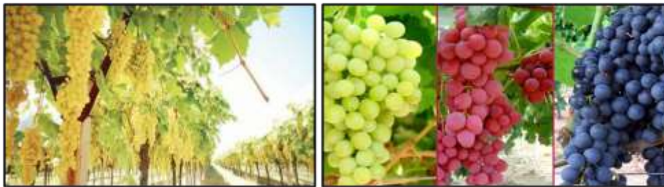
řekil 4: Alaşehir Blgesine zg zm trlerine ait (Url-6,Url-7).