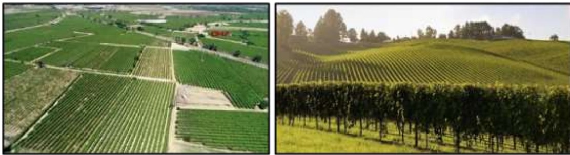
řekil 3: Alaşehir Blgesine ait bađ tarlarına ait grnt (Url-5)

Alaşehir ifti kayıt sistemi 2023 yılı verilerine gre; 20816,26(ha) kayıtlı bađ alanı bulunmaktadır (řekil 2). Bađ alanından yaklaşık olarak 200.000 ton zm retilmekte olup, bunun 39.078 tonu ihra edilmektedir. İhracat geliri 124.5 milyar dolardır. Blgede yetiřtirilen zmn byk ođunluđunu (řekil 3) Sultani ekirdeksiz eřidi ( Vitis vinifera L.) oluřturmaktadır(řekil 4). Sobran ve Kavaklıdere blgelerinde řaraplık zm retimi ile beraber, řarap retim tesisleri ve tadım mekanları bulunmaktadır.