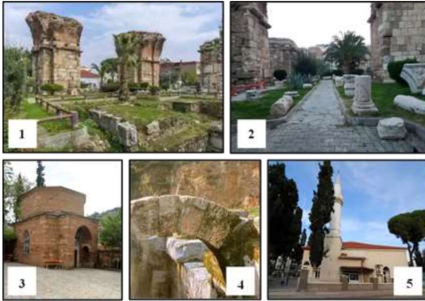
Şekil 5: Alaşehir ilçenin tarihi mekanlarına ait görünüm; St. Jean Kilisesi(1-2),Şeyh Sinan Türbesi-3, Alaşehir Surları-4,Yıldırım Beyazıt Cami-5(Url-9).